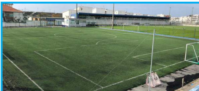
RELVADO SINTÉTICO (campo de aquecimento)